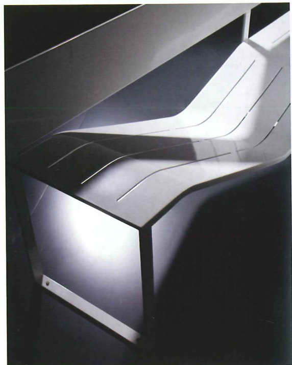
Soft Bench. Design : Lucile Soufflet/Édition TF