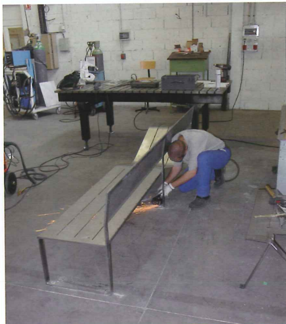
Prototypage du banc Soft Bench