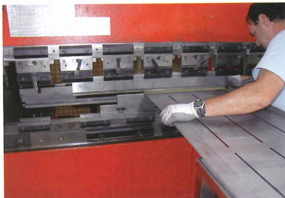
Pliage du banc Soft Bench