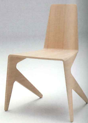
Chaise Mosquito (Wild Spirit).