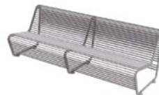
LINE BENCH DOS / LINE BENCH WITH BACKREST

L 690 mm H 800 mm P 900 mm |h| 390 mm kg 60