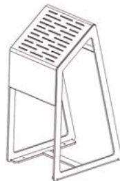
ASSIS DEBOUT / SIT/STAND SEAT