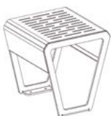
TABOURET / STOOL