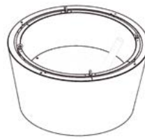
JARDINIÈRE / PLANTER