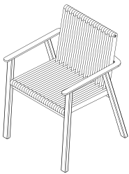
CHAISE / CHAIR