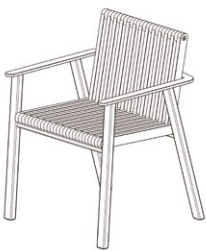
FAUTEUIL / ARMCHAIR