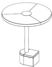
PARASOL / SUNSHADE